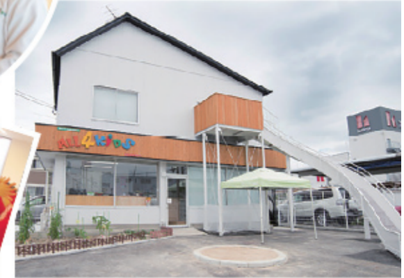
▲ALL4KIDS チャイルドケア勝川園