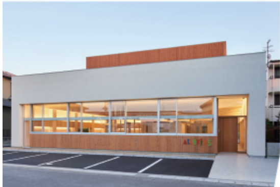
▲ALL4KIDS ナーサリースクール勝川