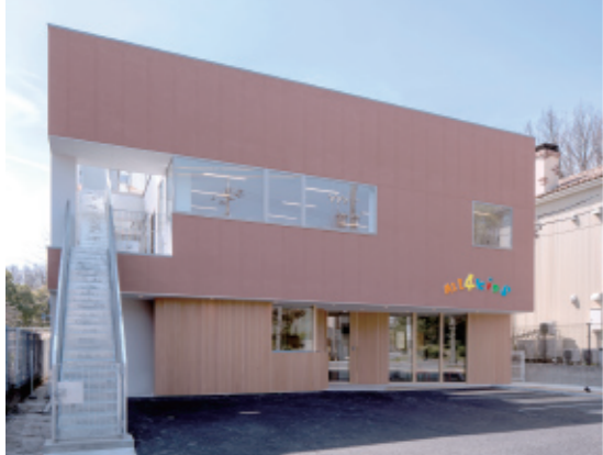
▲ALL4KIDS ナーサリースクール植田山