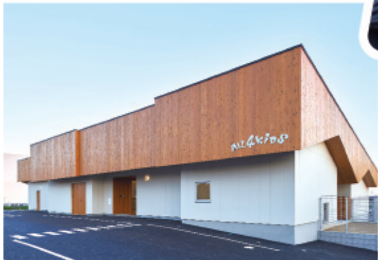
▲ALL4KIDS ナーサリースクール刈谷