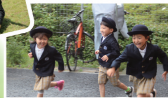
▲ALL4KIDS チャイルドケア穂波園