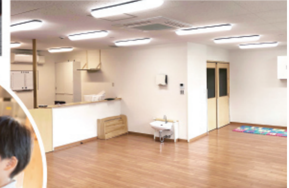
▲ALL4KIDS チャイルドケア徳川園

毎日子どもたちの笑顔を見ることが ALL4KIDSスタッフの願いです。 充実した毎日のために……。